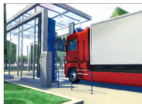
Portique de lavage