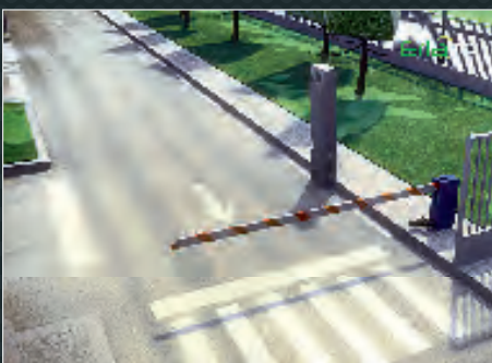
Contrôle d'accès portail

Evolutif, l'automate de gestion Epack asservit et centralise les périphériques de votre station-service (monté sur borne ou coffret).