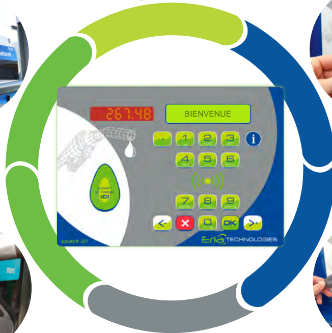
Par badges sans contact RFID