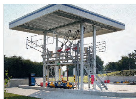
Poste de chargement