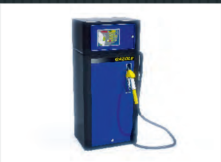
Distributeurs carburants, Adblue, gaz