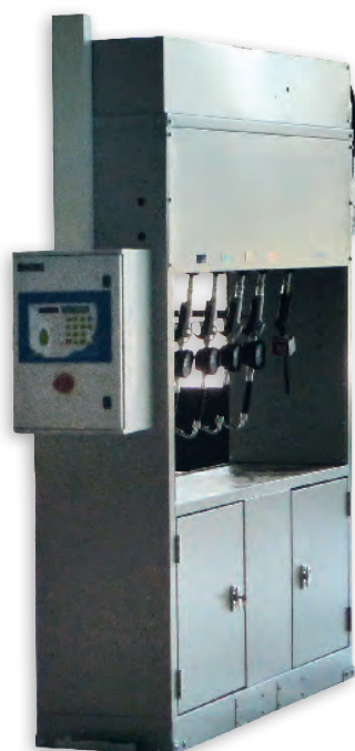
Lubrifiants, fluides industriels