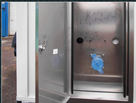
Adaptateur sec normé pour opération de dépôtage