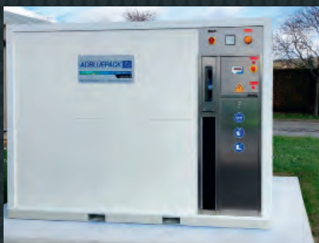
Sonde de détection présence produit dans bac de rétention incorporée + alarme locale ou déportée